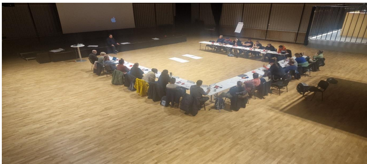
Bilde fra kurset ny som tillitsvalgt som vi hadde i samarbeid med avd. 10.