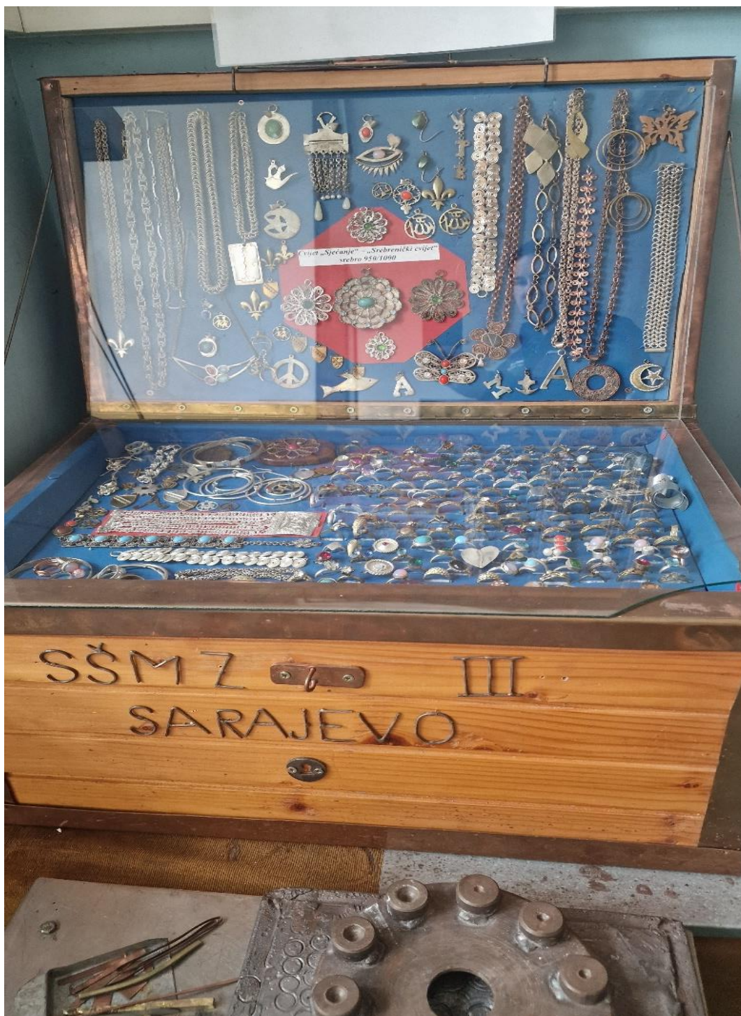
Fra yrkesskolen i Sarajevo som internasjonalt utvalg besøkte i desember 2022.